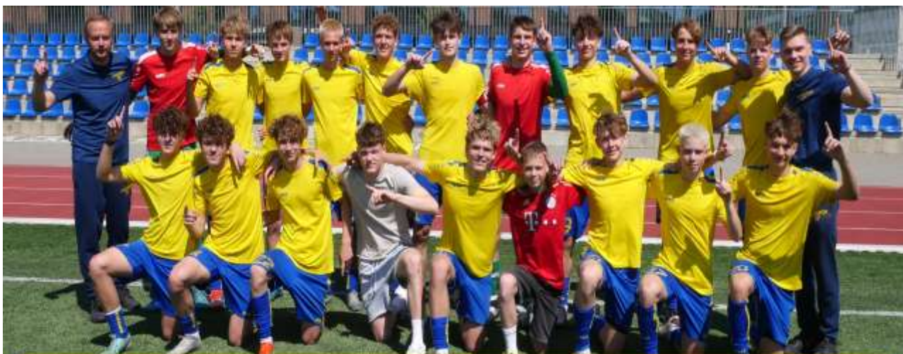
2 pav. Klaipėdos futbolo mokyklos U-16 komanda – 2024/2025 m. Lietuvos Elitinės lygos čempionė

Pilnai apie strateginio veiklos plano ir lūkesčių rašto įgyvendinimo rezultatus galima susipažinti įstaigos svetainėje: www.klaipedosfm.lt – Veiklos dokumentai – Veiklos ataskaitos ir vertinimai